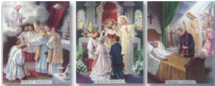
Holy Order Order Sagrado